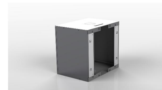
Minirack vist uden bagplade

Rigtig gode ventilationsmuligheder. Passiv ventilationsmuligheder i top og bund. I top og bund er der ligeledes mulighed for eftermontering af 1 stk. ventilator.