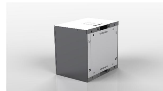
Minirack vist med bagplade (købes ekstra).