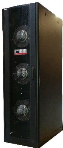
Sidecooler indbygget i sort Optiorack, 41,3kW