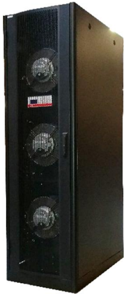
Sidecooler indbygget i sort Optiorack, 41,3kW