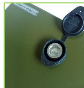
Lås med plastkappe – kan plomberes og anvendes til systemnøgle