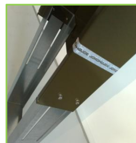
Integreret justerbar sokkel