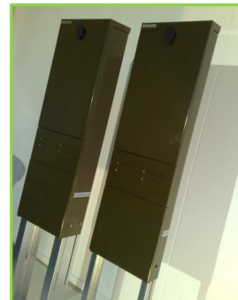
Funktional og innovativt design